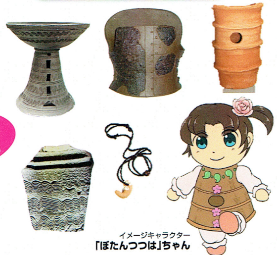
イメージキャラクター 「ぼたんつばは」ちゃん