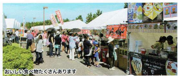
おいしい食べ物たくさんあります