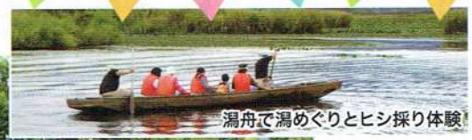
潟舟で潟めぐりとヒシ採り体験！

※出演者・出演時間は都合により変更になる場合があります。 ※雨天時は6階展望ホールに会場を変更して開催します。