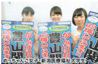
めっちゃ女子・新潟医療福祉大学生