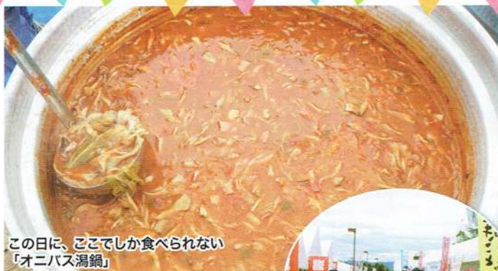
この日に、ここでしか食べられない「オニバス潟鍋」