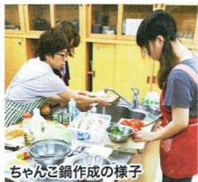
ちゃんこ鍋作成の様子