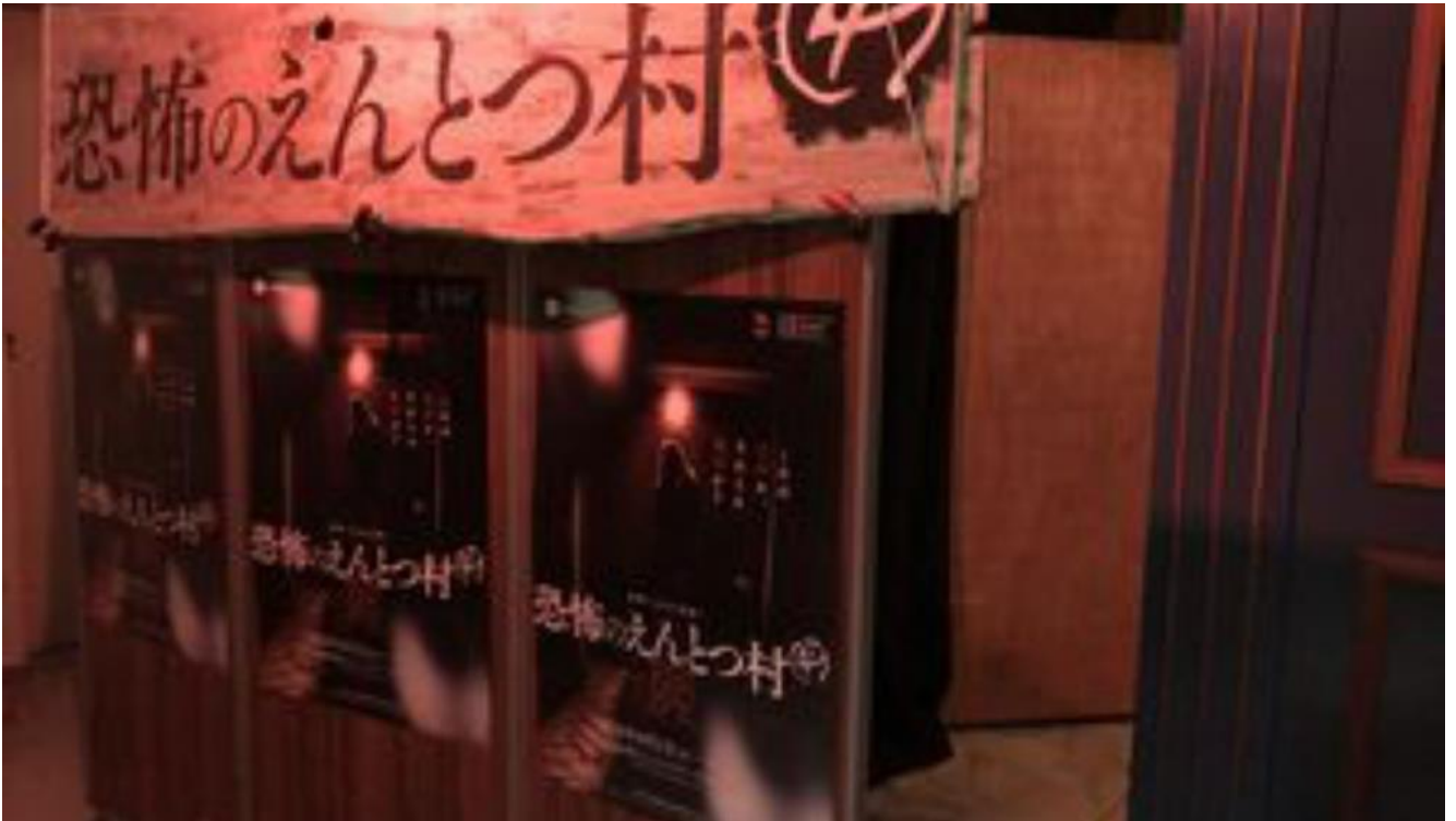
お化け屋敷入口：新潟古町 えんとつシアター7階特設会場