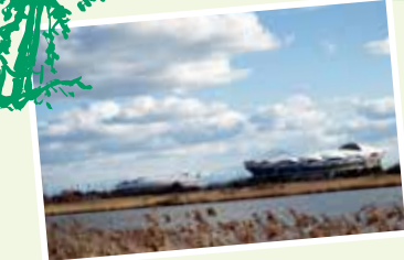
鳥屋野湯 (新潟市中央区)