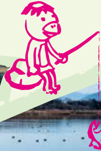
上堰湯 (新潟市西蒲区)